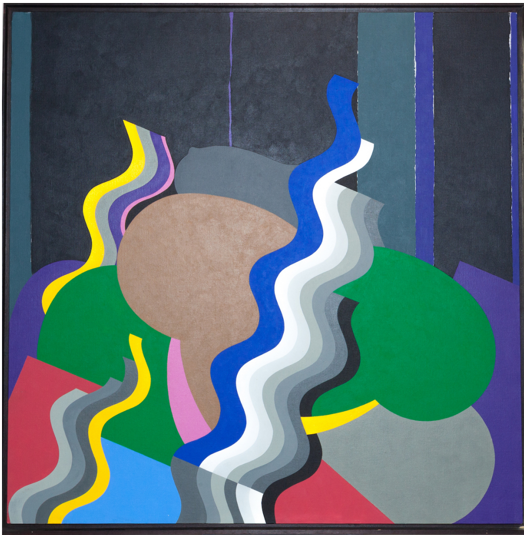
Mohamed Melehi Sans titre , 2008 150 x 150 cm Technique mixte sur toile