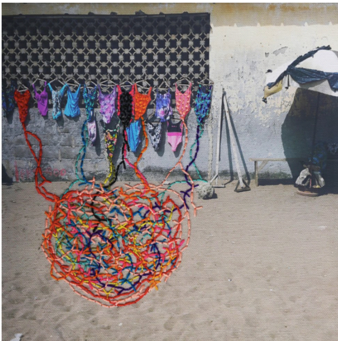
8. De la serie Ça va aller . 2016.