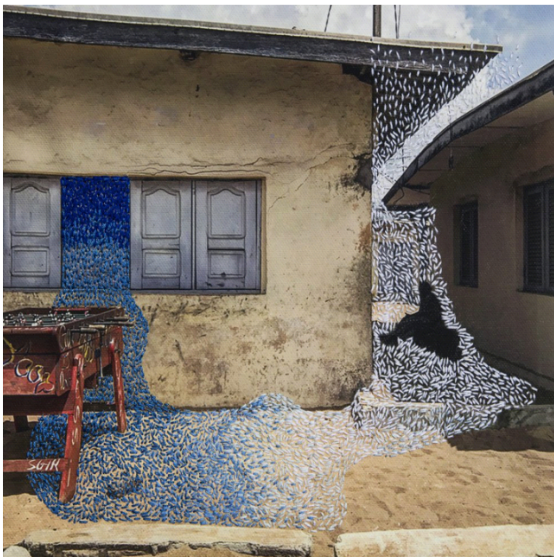
6. De la serie Ça va aller. 2017.