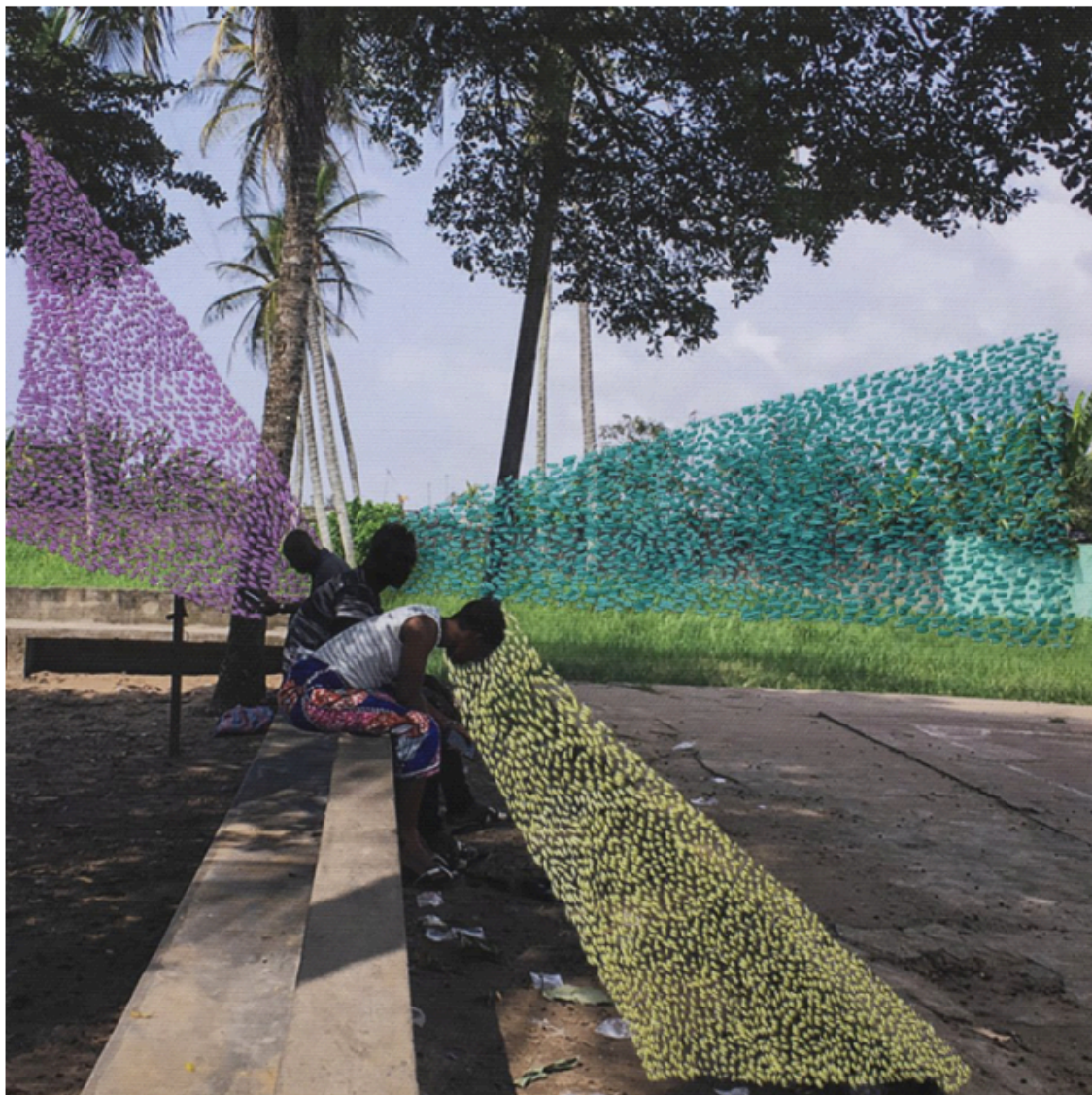
5. De la serie Ça va aller. 2019.