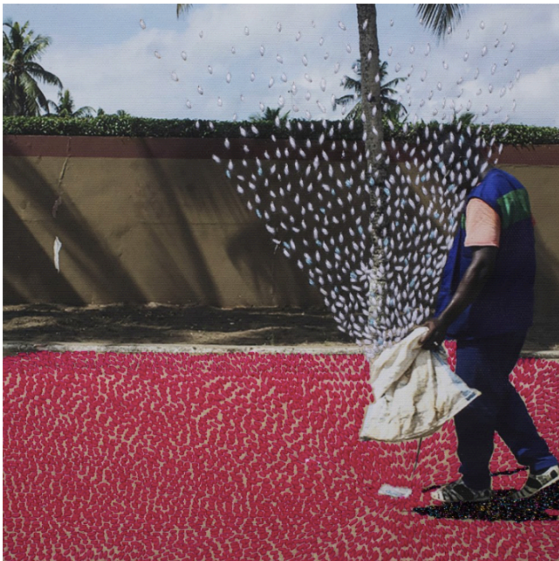
11. De la serie Ça va aller. 2018.