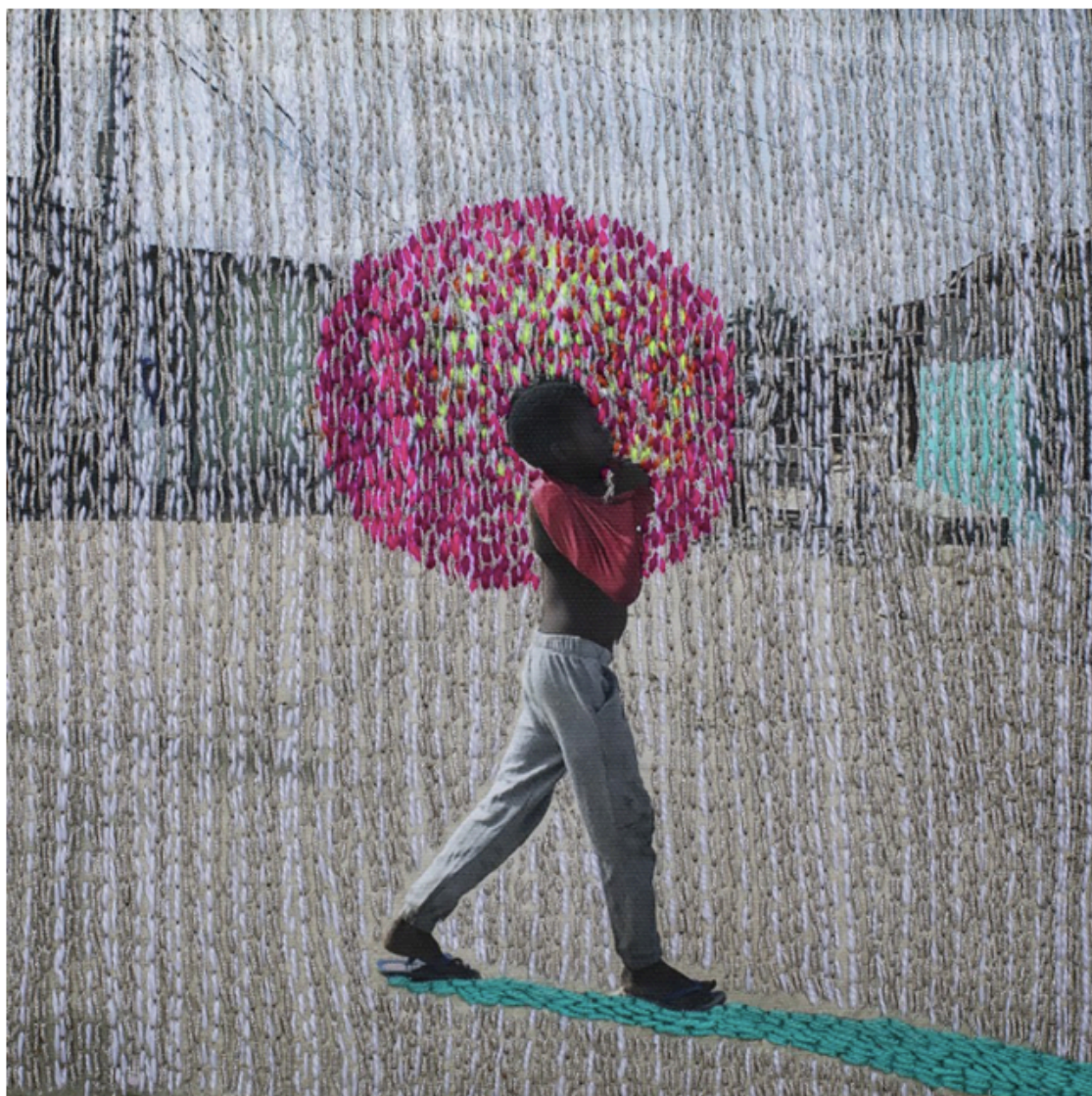
7. De la serie Ça va aller. 2018.