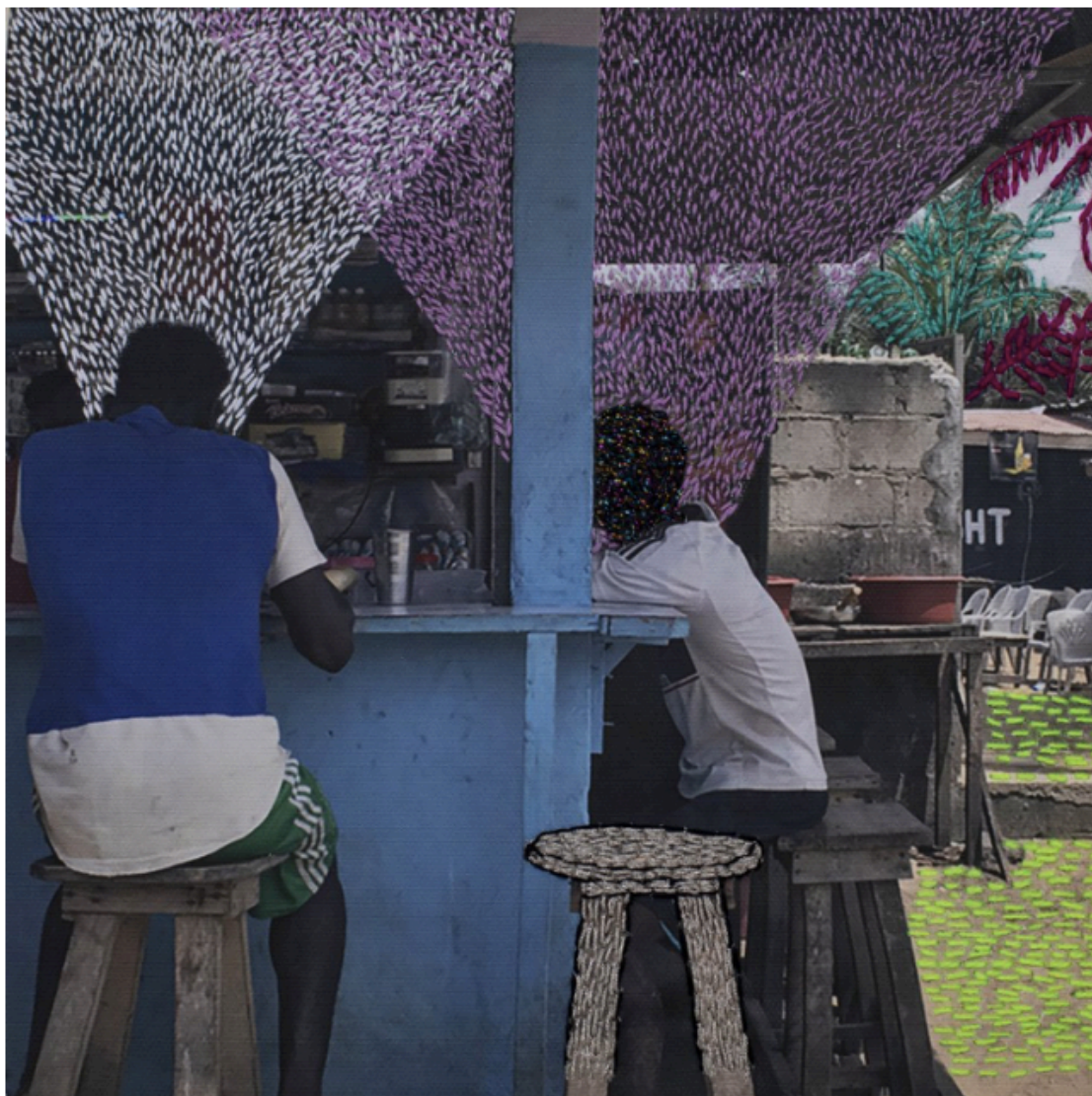
9. De la serie Ça va aller. 2018.